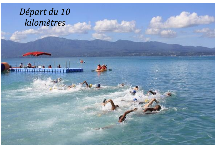
Départ du 10 kilomètres

Le second axe est relatif aux disciplines sportives que sont la natation synchronisée, l'eau libre et la natation course. Dans toutes ces pratiques, chaque saison des nageurs évoluent au niveau national. La natation-course se distingue avec depuis 6 ans 1 à 2 nageurs par saison sélectionnés en équipe de France Jeunes. De plus, tous les ans, des nageurs intègrent des pôles France Nationaux et les grandes structures hexagonales.