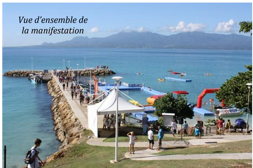
Vue d'ensemble de la manifestation

L'aspect sport-santé n'est pas en reste avec « nou tout an dlo la » qui, avec l'aide de partenaires multiples, permet aux personnes atteintes de maladies chroniques de pratiquer de la natation.