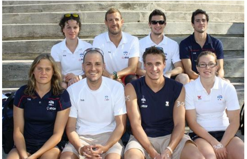
Nageurs de l'Équipe de France en Eau Libre