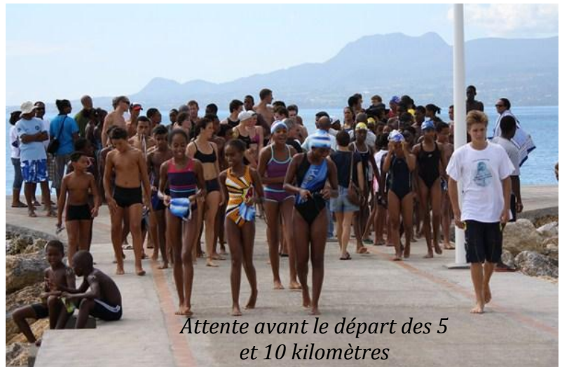
Attente avant le départ des 5 et 10 kilomètres